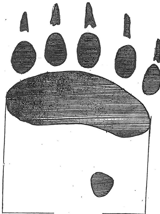
Karhun etutassun keskianturan leveys