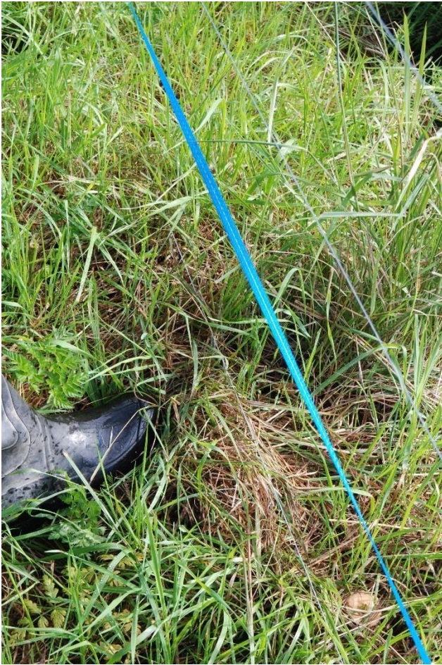
Kuva 3. Alin noin 15cm korkeudella oleva sähkölanka on pahasti heinän seassa, mutta silti iskuenergia on noin 4 J. Yökasteen aikana iskuenergia putoaa kuitenkin lähelle nolaa.

jopa vain kerran kesässä. Osan kasvintorjunta-aineiden käyttö on kiellettyä luomutiloilla ja perinnebiotoopeilla, eikä niitä ole yleisestikään suositeltavaa käyttää liikaa. Muita keinoja ovat esimerkiksi suolaliuos sekä kuuma höyry ja sokeripitoinen vaahto. Näitä käytetään esimerkiksi kaupunkien viheralueiden hoidossa, mutta olisivat sovellettavissa myös tähän tarkoitukseen. Hoitamisen helpottamiseksi aidan alle voidaan rakennusvaiheessa asentaa esimerkiksi mansikkamailla rikkaruohojen kasvun estämiseksi käytettävää muovikalvoa.