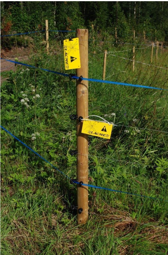
Kuva 1. Eräällä tilalla Salossa petoaidassa on neljä vaijeria ja kaksi aitanauhaa. Aitaan on syytä merkitä varoitukset voimakkaasta sähkövirrasta.

Suomen riistakeskukselta on mahdollista hakea ilmaisia tarvikkeita petoaitoja varten. Maa- ja metsätalousministeriö myöntää avustusta vuosittain 300 000€ Suomen riistakeskukselle suurpetovahinkojen ehkäisemiseksi, ja osa näistä kohdennetaan tuotantoeläinten suojaamiseen tarkoitettuihin sähköistettyihin petoaitoihin. Jotta petoaita voidaan tilalle myöntää, on kyseessä oltava riittävän suuri tuotantoeläintila. Pääsääntönä on, että aidattavan arvo on oltava suurempi kuin aidan arvo. Aitoja ei myönnetä harrastuseläimille, kotipihan aitaukseen, pienille eläinmäärille tai perinnebiotoopeille, joita laiduntaa pieni eläinmäärä.