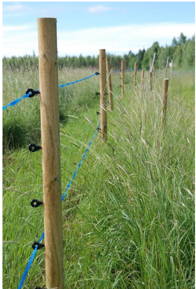
Kuva 4. Kasvillisuus on niitettävä riittävän leveältä alueelta, jotta heinä ei kaadu kasvaessaan aitalankojen päälle.

Mehiläistarhojen suojaamisessa sähköistetty aita toimii myös hyvin. Karhulle aidan korkeudeksi riittää noin metri, mutta alin lanka saa olla myös korkeintaan 20 cm korkeudella maasta. Lankoja tai aitanauhoja karhuaidassa on yleensä neljä noin 25-30 cm välein. Tarhaajan on Suomen riistakeskukselta aitoja saadaksesen oltava tukikelpoinen tuottaja, jolla