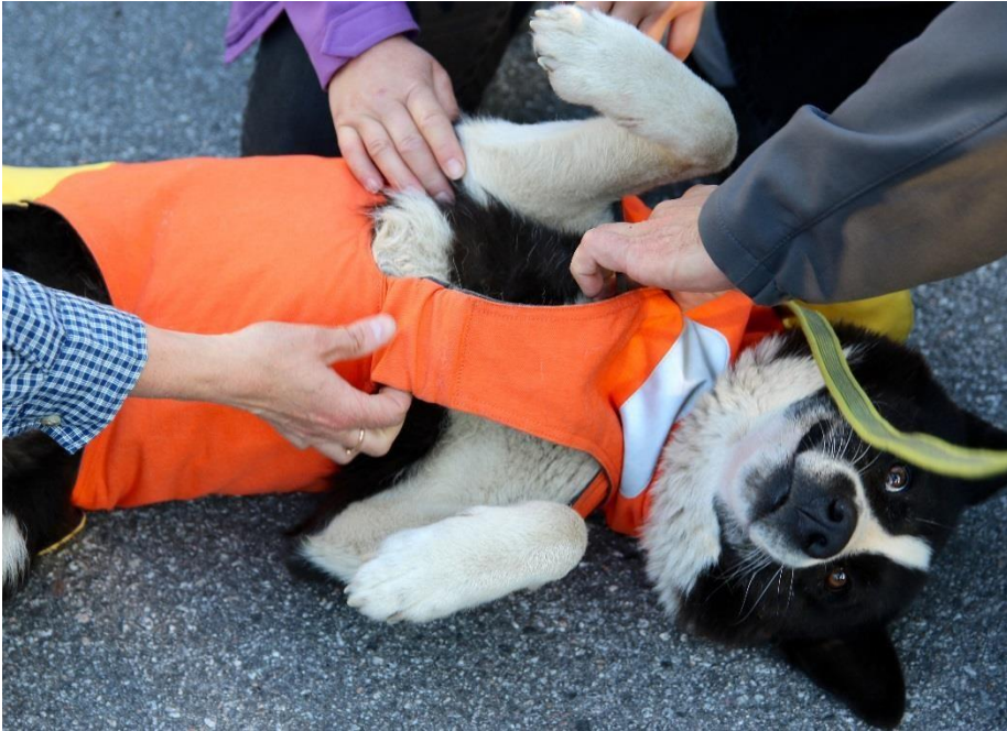
Kuva 10. Mithril-liivi suojaa hyvin myös koiran vatsan, kaulan ja rinnan. Rintaosan leikkaus estää lumen joutumista liivin alle.

Suurin osa koirille tarkoitetuista suojaliiveistä on tehty kevlar-tyyppisestä kankaasta. Kangas on pääsääntöisesti erittäin kestävä, eikä siitä pääse hammas läpi. Kankaan paksuus ja kerrosten määrä vaihtelevat suuresti, mikä vaikuttaa suoraan myös liivin jäykkyyteen. Jos kerroksia on useita ja kangas on jäykkää, tulee myös suojaliivistä erittäin jäykkä. Monet koiranomistajat karsastavatkin näitä jätkeä liivejä koiran liikkuvuuden rajoittamisen takia. Koiran nopeus ja ketteryys heikkenevät liian jäykän liivin kanssa, mikä vaikuttaa myös koiran pakenemiseen pedoilta. Jäykkä liivi kuitenkin suojaa tehokkaammin purentavoimalta kuin pehmeä ja notkea liivi; sudet usein pyrkivät puremaan koiraa kaulaan, selkään tai perään, jolloin koira halvaantuu. Ainakin yhteen liivimalliin (Dogtech Protector Pro) on mahdollista liittää myös rautapiikit selkäosaan, jotka suojaavat tehokkaasti puremiselta selkään. Piikit saattavat kuitenkin vaikuttaa koiran liikkumiseen esimerkiksi tiheissä ryteköissä tai ahtaissa onkaloissa. Pehmeät ja notkeat suojaliivit (esim. Mithril) on suunniteltu muun muassa ilveksen ja villisian metsästykseseen, jossa on tärkeää koiran nopea liike ja liivin suojaaminen kynsimiseltä ja villisian torahampaiden viilloilta. Tällainen liivi voi toimia myös suden hyökätessä, jos susi ei saa koirasta kunnolla kiinni ja koira pääsee karkuun. Kevlar-liivien hinnat vaihtelevat 200€-600€ välillä.