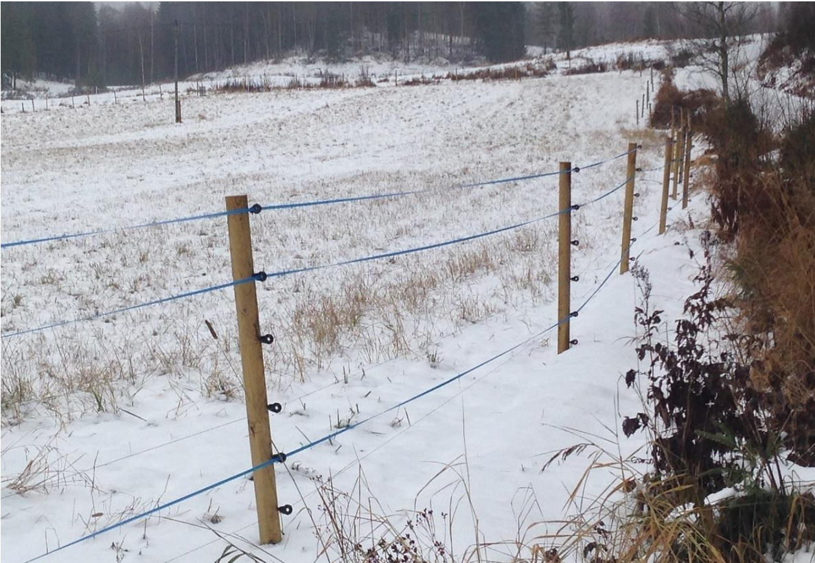
Kuva 13. Alinta lankaa on nostettu yhdessä tolpassa, koska se ottaisi muuten maahan ja lumeen.

Talvisin suurta osaa petoaitoja ei tarvita, kun tuotantoeläimet ovat sisätiloissa suojassa. Sähköisiä aitoja olisi kuitenkin suositeltavaa pitää päällä myös talvella, sillä pedot voivat pyrkiä laitumille myös silloin. Jos aidoissa ei ole sähköä, oppivat pedot aitojen olevan vaarattomia. Petojen olisi kuitenkin opittava, että laitumelle ei sovi tulla milloinkaan. Talvella vaikeuksia aiheuttaa kuitenkin lumi, sillä se peittää langat ja toimii eristimenä eristämällä eläimen maasta, jolloin se ei saa sähköiskua koskettaessaan sähkölankoja. Lumen auraaminen aitojen alta ja ympäriltä on erittäin vaikeaa, mutta jos aidan rakentaa riittävän etäälle ojan reunasta, pääsee ojan ja aidan väliin traktorilla. Aitojen sijoittamisesta peltolohkoilla kerrotaan enemmän alempana.