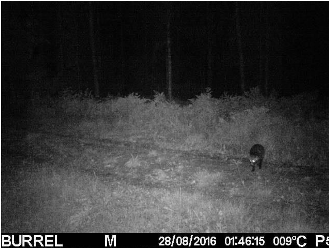
Kuva 7. Supikoira yöllisellä kävelyllä.

Eläinten suhtautuminen riistakameroihin vaihtelee. Osa ei välitä lainkaan, osa kiinnostuu ja osa jopa pelkää niitä. Riistakamerat käyttävät pimeään aikaan joko infrapuna- tai inframustasalamaa. Infrapunasalamaasta näkyy himmeä punainen valo pimeällä, jota osa eläimistä saattaa säikähtää. Inframustasalama on täysin näkymätön, ja sitä eivät edes eläimet havaitse. Kameroista kuuluu myös pieni naksahdus kuvaa otettaessa, jota osa eläimistä voi myös pelästyä. Jotkin eläimet kuitenkin kiinnostuvat kameroista ja tulla lähemmäs tutkimaan sitä.