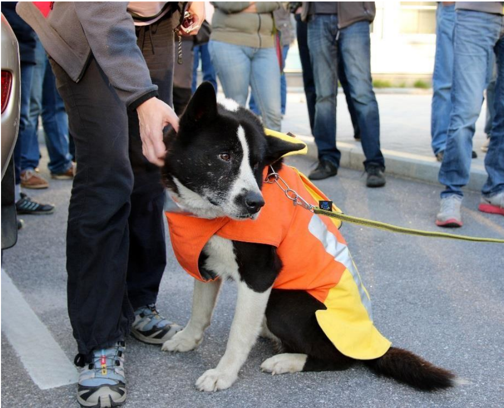
Kuva 14. Mithril-liivi istuu napakasti karjalankarhukoiran päällä, eikä se kiristä koiran istuessakaan mistään.

Suojaliivin koettiin hidastavan koiran liikkumista vain aavistuksen, mutta merkittävää vaikutusta sillä ei ollut. Parhaina puolina liivissä pidetään juuri sen joustavuutta ja notkeutta. Liivin muotoilu on onnistunut, sillä se ei kerää liikaa lunta liivin alle. Liivi suojaa myös kattavasti todennäköisimmät kohdat, joihin sudet yleensä iskevät. Kyseistä koiraa, jolle Mithril-liivi tilattiin, käytetään myös karhu- ja ilvejahdeissa. Erityisesti ilvekset saattavat raapia koiraa rintaan tai vatsaan, ja tässä liivissä myös nuo paikat ovat hyvin suojattuja. Myös kasvavan villisikakannan metsästyksessä liivi tuo tarvittavaa suojaa villisikojen torahapaita vastaan.