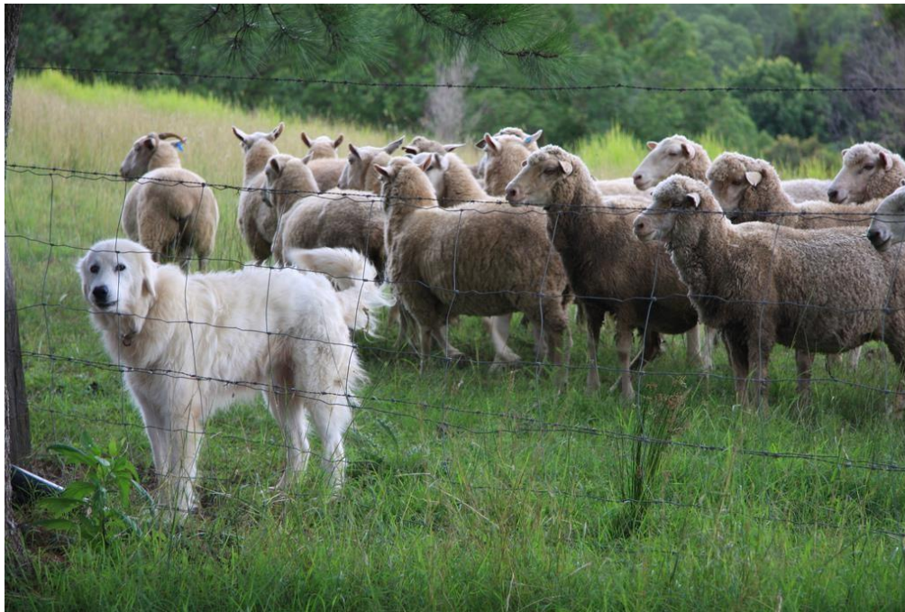
Kuva 5. Maremmano-abruzzese- rotuinen laumanvartijakoira lammaslaumansa kanssa.

Eläintiloilla on alettu enenevässä määrin käyttää kookkaita laumanvartijakoiria eläinten suojaamiseksi. Laumanvartijakoirat suojaavat tehokkaasti kaikilta uhkilta vieraista ihmisistä suurpetoihin. Koirat elävät jatkuvasti suojeltavien eläinten keskuudessa ulkona tai sisällä, ja niiden turkki on erittäin paksu ja tiheä suojaamaan säältä kuin säältä. Rotuja on kymmeniä, joista esimerkkeinä kaukasiankoira, pyreneittenmastiffi, akbash, maremmano-abruzzese ja anatoliankoira. Roduissa on ulkoasussa ja käyttäytymisessä eroja, mutta enemmän merkitsee yksilöiden luonne. Laumanvartijakoirien menestys on suurimmalta osin riippuvainen kasvattajan kyvystä kouluttaa ja valita tehtävään sopiva yksilö. Koira suojelee niitä eläimiä, joihin se on leimautunut pennusta lähtien. Ensimmäinen vuosi onkin erittäin tärkeä koulutuksen kannalta, sillä sinä aikana pentu oppii, miten suojeltavien eläinten kanssa tulee olla. Kehittyminen tehokkaaksi työkoiraksi saattaa kestää jonkin aikaa, mutta onnistuessaan tuloksena on yksi tehokkaimmista eläinten suojauskeinoista.