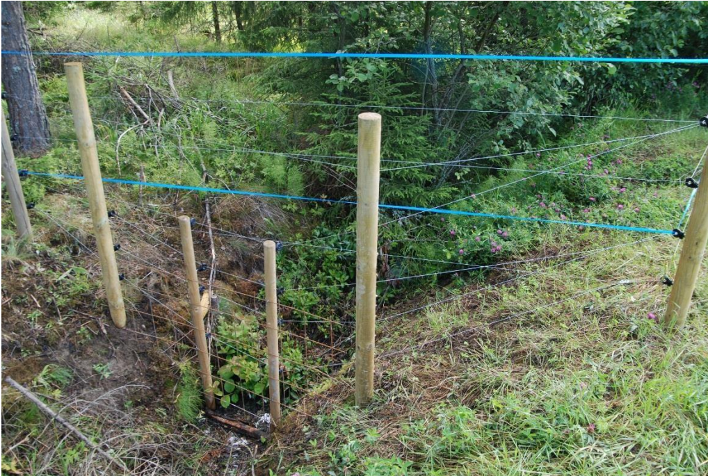
Kuva 2. Ojien ylityksissä on oltava huolellinen. Tässä sähkölangat on vedetty oja myötäillen aputolppien kanssa, ja lisäksi ojaan on laitettu rautaverkkoa. Tulva-aikana ojan virtaus voi estyä verkon eteen kerääntyvän roskan takia.

Kesäaika on kotieläintiloilla työntäyteistä aikaa, jolloin ylimääräiselle aitojen hoitotyölle ei juuri jää aikaa. Monella tilalla aitojen hoitoon jouduttaisiin palkkaamaan ulkopuolista työvoimaa. Eniten eläintilallisia huolettaakin sähköistetyin petoaidan hoito. Koska alin lanka on vain 20cm korkeudella maasta, kasvaa ruoho kosketuksiin langan kanssa melko nopeasti. Jos kasvillisuutta on liikaa langassa kiinni, maadoittaa se sähkövirran tehokkaasti pois. Tällöin aidasta ei saa riittävän kovaa sähköiskua, jos eläimet yrittävät siitä läpi. Kasvillisuutta voidaan poistaa joko mekaanisesti tai kemiallisen torjunnan kautta. Mekaaninen poisto tarkoittaa esimerkiksi trimmeriä, raivaussahaa, traktoriin kiinnitettävää niittokonetta tai muita pienkoneita. Kemiallinen torjunta tapahtuu käyttämällä esimerkiksi kasvintorjunta-aineita tai kuumaa höyryä.