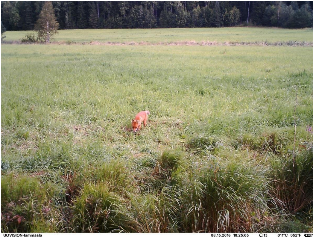
Kuva 8. Kettu haistelemassa lammaslaitumen vieressä.

pedoista, ja tätä tietoa käyttämällä voidaan varautua paremmin petouhkaan ja suorittaa mahdollisia karkotuksia. Tietoa saadaan myös laitumen ympärillä liikkuvista muista kulkijoista, kuten irrallaan olevista koirista tai ihmisistä. Tätä kautta eläintenpitäjät saavat itse hankittuja havaintoja susista ja niiden käyttäytymisestä, sekä apuja eläinten käyttäytymisen tulkintaan. Jos vahinko tapahtuu, saadaan riistakameroiden ottamista kuvista myös apua niiden selvittelyyn. Tiedossa on esimerkiksi sellainen tapaus, jossa tallentava riistakamera on ottanut kuvia lampaiden laidunta tarkkailevista susista samana iltana, kun sudet ovat tappaneet lampaita kyseisellä laitumella. Tässä tapauksessa riistakamera ei ollut lähettävä, joten kuvia päästiin tarkastelemaan vasta vahingon tapahduttua.