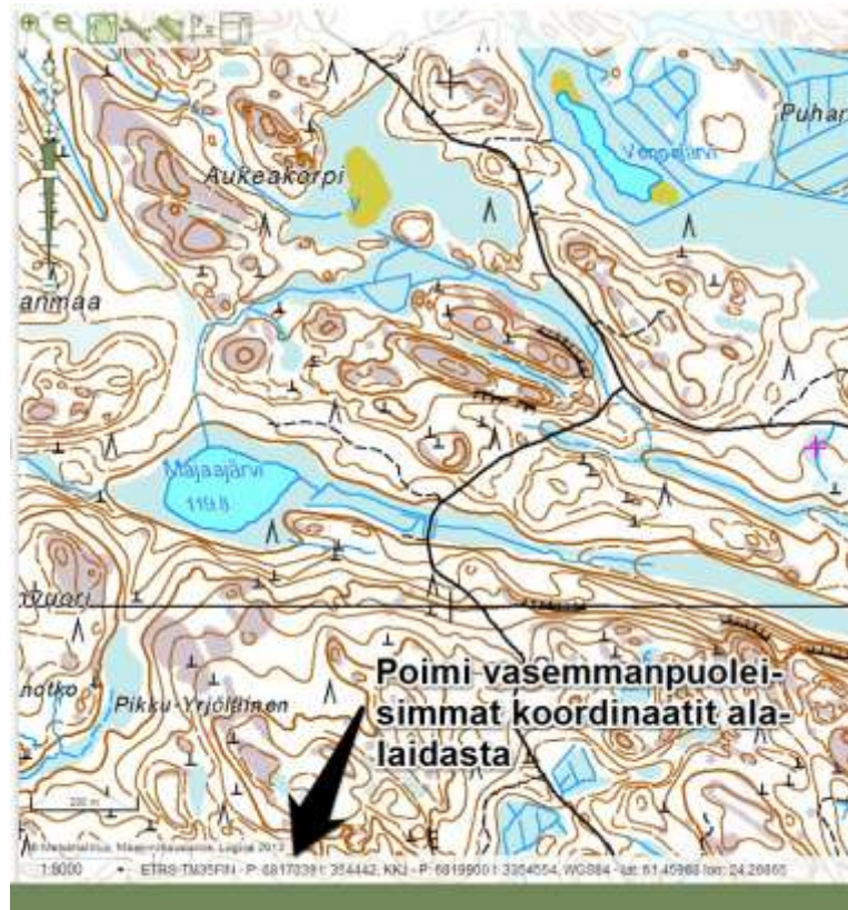
Figur 1. Flytta kursorn till önskad plats på skärmen och plocka ut ETRS-TM35FIN-koordinaterna från kartans nedre kant.