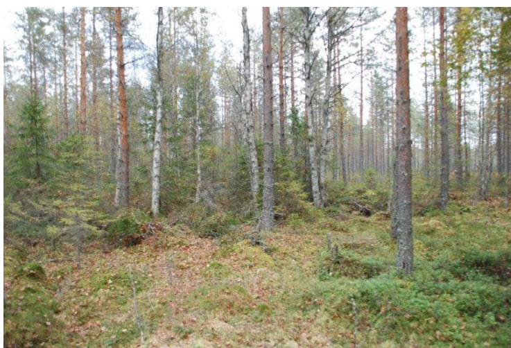
Kuva 4: Arvioi ennakkoraivauksen tarve huolellisesti. Kuvan tilanteessa todellista raivaustarvetta ei ole, sillä näkyvyys puiden tyville on riittävä.

Sekametsäisyyden turvaamiseksi säästetään vähintään kolmea puulajia. Havupuuvaltaisessa metsässä toisen havupuulajin ja lehtipuun yhteenlasketun osuuden tavoite on vähintään 20 - 30 % ja pääpuulajin korkeintaan 80 % kokonaistilavuudesta. Lehtipuita voi kohdentaa kuvion reunoille ja erityisesti Pohjois-Suomessa riistatiheiköihin, jolloin ne eivät vie liikaa kasvutilaa tukkipuiksi kasvavilta havupuilta. Reunoilla, mutta myös muissa kuvion osissa lehtipuita voidaan suosia kustannustehokkaasti, kun vaihtoehtona on huonolaatuisia havupuita. Poikkeuksena on leppä, joka kannattaa säästää pääosin metsikön suojaisemmissa osissa.