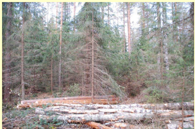
Kuva 5: Harvennuksen jälkeinen puusto on tiheydeltään vaihteleva ja monilajinen, mutta kuvan kohteella alikasvosta on liikaa hakkuukoneen kuljettajan kannalta ja tarpeettoman paljon jopa riistan kannalta.