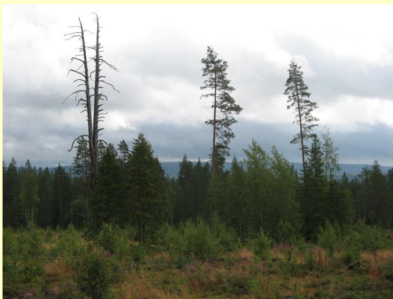
Kuva 2: Eri puulajeista koostuvat vaihtelevat ja rakenteeltaan kerrokselliset säästöpuuryhmät tarjoavat riistalle parhaiten suojaa ja ravintoa.