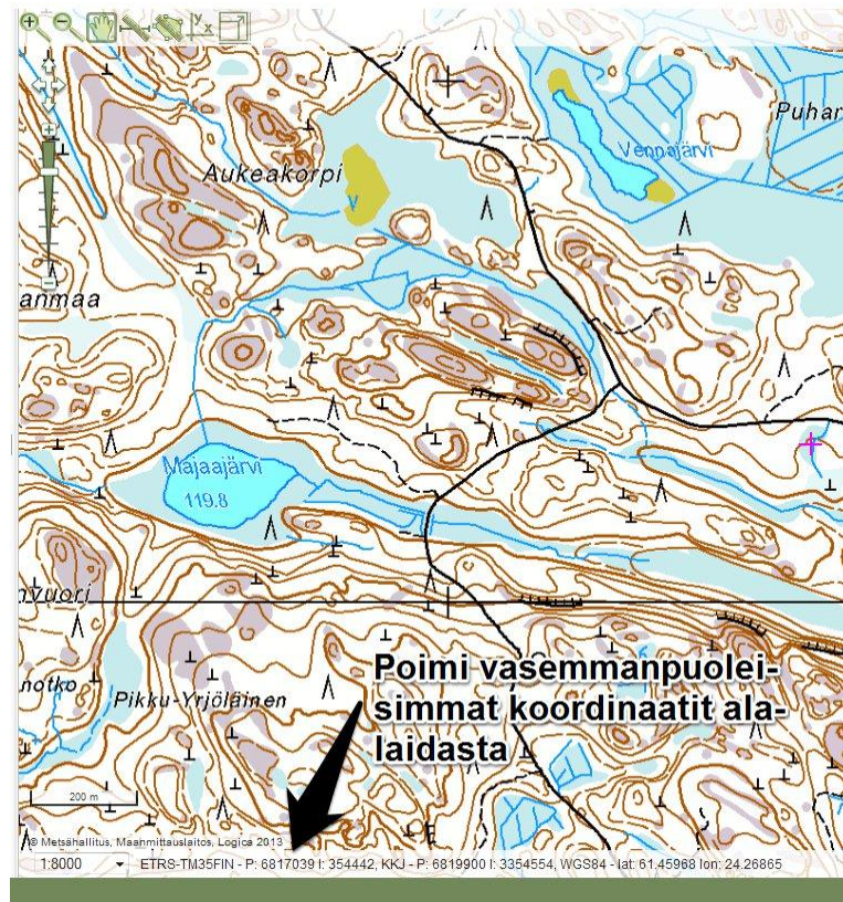
Kuva 1. Näkymää Retkikartta.fi sivustolta. Liikuta kursori näytöllä haluamaasi kohtaan ja poimi ETRS-TM35FIN-koordinaatit kartan alareunasta.