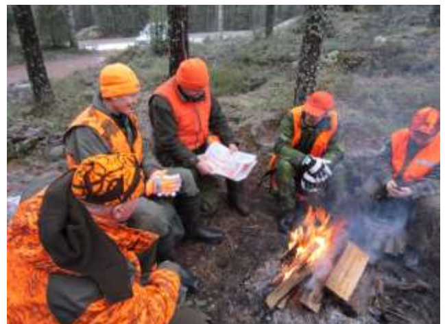
Punanutut ovat vaihtuneet oranssinuttuihin, mutta perinteinen paperikartta pitää vielä pintansa sähköisten järjestelmien rinnalla.

Johtajan tulee varmistaa se, että kaikilla seurueen metsästäjillä on asianmukaiset varusteet. Metsästyksasetuksen 22. pykälän mukaan metsästettäessä muita hirvieläimiä kuin metsäkaurista ylävartalon peittävästä vaatetuksesta sekä päähineestä tulee olla 2/3 oranssia tai oranssinpunaista. Turvavaatetuksesta ei saa tinkiä. Asetus ei koske rakennelman suojasta metsästämistä. Tavanomaista hirvitornia ei katsota tällaiseksi rakennelmäksi.