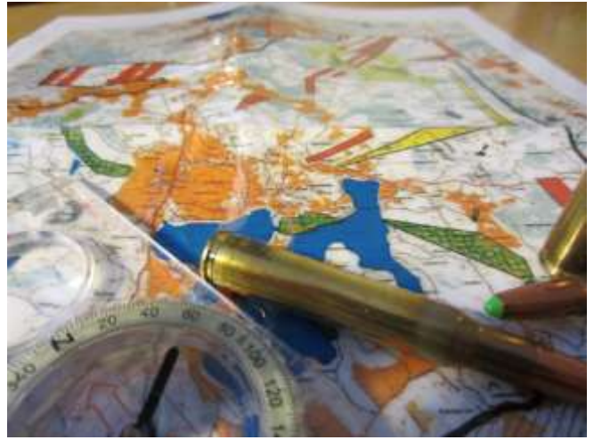
Useimpien seurojen alueilla on metsästysrajoituksia. On suositeltavaa, että jokaisella metsästäjällä on jonkinlainen kartta, jossa rajoitukset näkyvät. Tänä päivänä ne voi näppärästi merkitä myös esimerkiksi älypuhelimien karttaohjelmaan.

Metsästyksenjohtajan on oltava tietoinen myös mahdollisista muutoksista metsästysvuokrasopimuksissa. Muutoksista on ehdottomasti tiedotettava metsästysseurueelle riittävän hyvin. Metsästyksenjohtaja voi näyttää aloituspäivän aamuna seurueelleen kartan, johon hirvenmetsästykseseen vuokraamattomat alueet on selvästi merkattu.