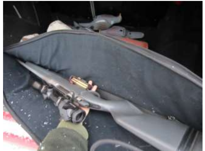
Aseiden kuljettaminen lipas irrotettuina on suositeltavaa eikä lippaan paikalleen laittaminen vie paljon aikaa.

Ase tulee ladata vasta passipaikalla. Hirvikoiran kanssa metsästettäessä ase voidaan ladata sitten, kun sovittu lähdetään hiipimään hirvihaukulle. Voidaan sopia, että koiramies voi ladata aseensa lähtiessään koiran kanssa maastoon.