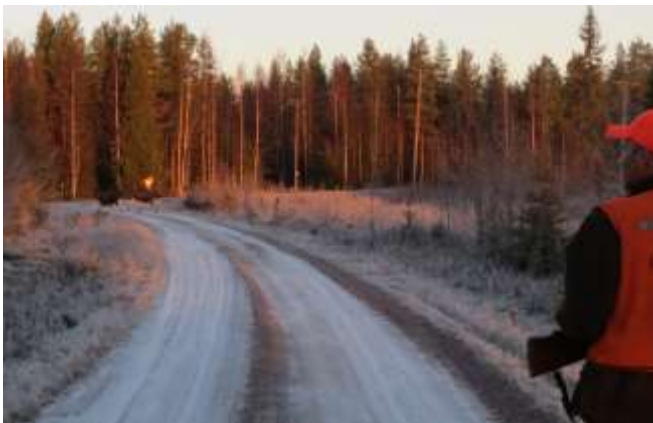
Ampumatilanteessa on aina varmistuttava ampumataustasta. Jos turvallisesta laukauksesta ei ole täyttä varmuutta, seurataan hirviä katseella.

Yksityisellä tiellä saa lain mukaan metsästää hirvieläimiä, mutta metsästys ei saa aiheuttaa vaaraa tiellä liikkujille. Turvallisuusnäkökohdat on otettava yhtä vakavasti kuin yleisen tien kohdalla. Tien suuntaisesti ei ammuta, ellei voida varmistua siitä, että tiellä ei ole muita kulkijoita.