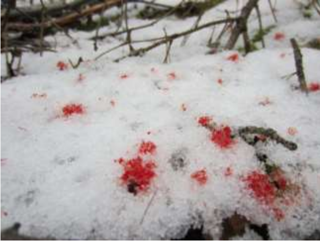
Runsas veri laikuittain lumella lupaa hyvää. Kuvan tapauksessa hirveä ei tarvinnut lähteä jäljittämään, vaan se löytyi kuolleena alle sadan metrin etäisyydeltä ampumapaikalta.

Haavoittuneen eläimen poistuttua vieraille metsästysalueelle on metsästyksenjohtajan ilmoitettava siitä viipymättä alueen metsästoikeuden haltijalle. Johtajalla tulee olla naapuriseurojen metsästyksenjohtajien puhelinnumerot. Todennäköisesti heillä on jahtipäivä samaan aikaan kuin oman alueen porukallakin, joten johtaja saadaan puhelimitse kiinni ja haavakkojahti voidaan aloittaa hyvässä yhteisymmärryksessä seuruiden kesken. Haavoittuneen hirven metsästä pois saaminen ylittää tärkeysjärjestyksessä muut metsästystapahtumat. Vasta haavoittuneen hirven lopettamisen jälkeen on aika selvittää, kenelle hirvi kuuluu.