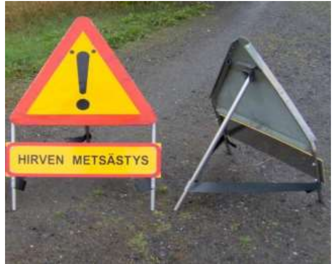
Hirvenmetsästyksessä käytettävä varoituserkekimalli.

Varoituserkillä pyritään estämään materiaali- ja koiravahinkoja. On muistettava, että liikenteen estäminen on kiellettyä, ja varoituserkeiden tarkoituksena onkin edistää yleistä turvallisuutta eikä omia tiettyjä metsäautoteitä pelkästään hirvenmetsästyksen.